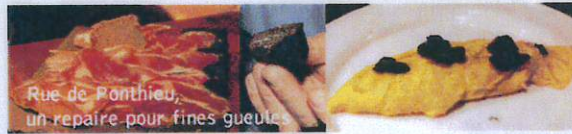
Rue de Ponthieu, un repaire pour fines gueules

>> Sommaire ■ CARTE DE PARIS ■ PARIS 16ème